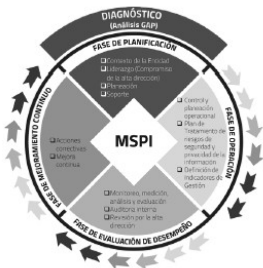
Ilustración 1 Ciclo del Modelo de Seguridad y Privacidad de la Información

Cada una de las fases se dará por completada, cuando se cumplan todos los requisitos definidos en cada una de ellas