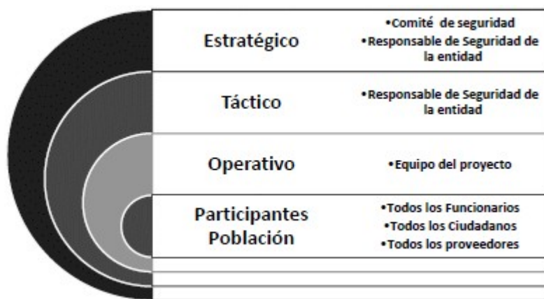
Ilustración 2: Equipo de Gestión de Seguridad de la Información en las entidades

Responsabilidades del equipo del proyecto: