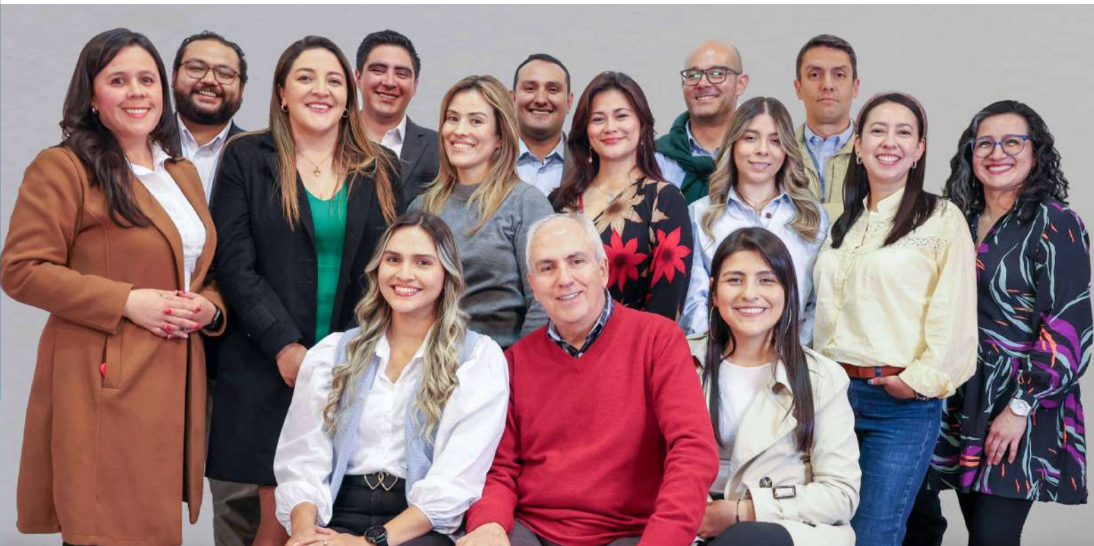
Integrantes Grupo Coordinación Nacional de Producción Normativa y Conceptos Jurídicos